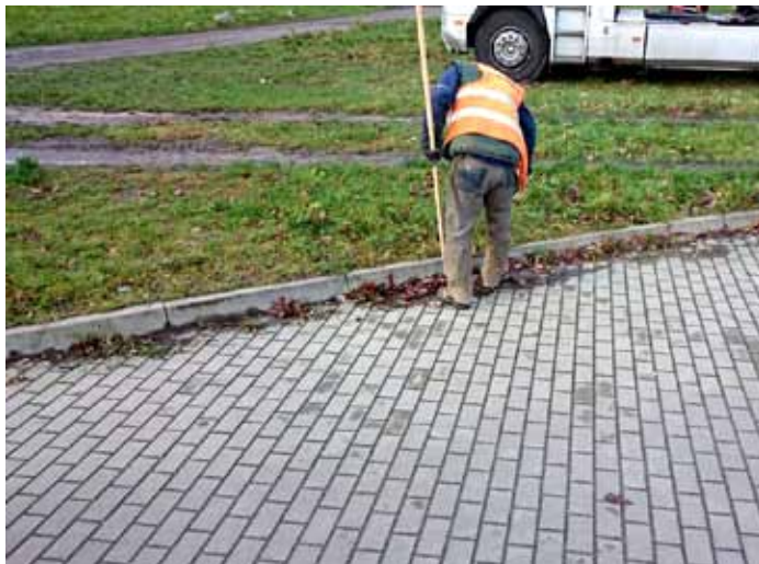
Wjazd do garaży sprzątanie terenu przy ulicy Zamkowej