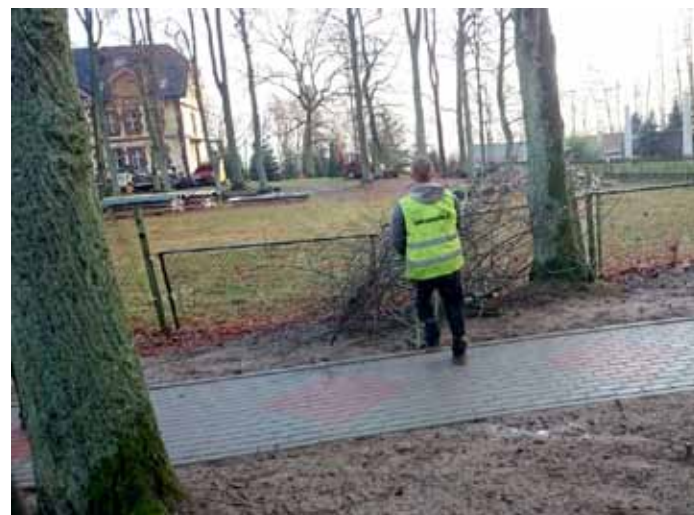
Pielęgnacja drzew przy ulicy Wojska Polskiego