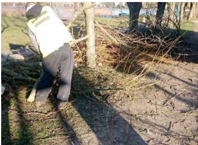
Pielęgnacja drzew nad jeziorem