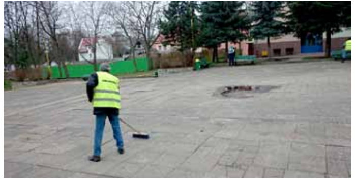
Sprzątanie placu wokół pomnika oraz alejki za Nowogardzkim Domem Kultury

Na terenie naszej Gminy trwały prace porządkowe. Prace wykonywane były przez osoby osadzone w nowogardzkim Zakładzie Karnym, stażystów Urzędu Miejskiego, pracowników interwencyjnych z Urzędu Pracy.