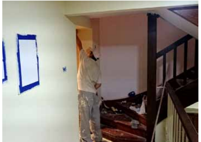
Remont korytarzy Urzędu Miejskiego