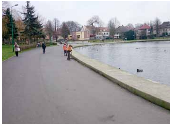
Uprzątnięcie alejki nad jeziorem