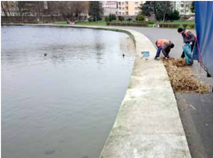
Czyszczenie brzegu jeziora