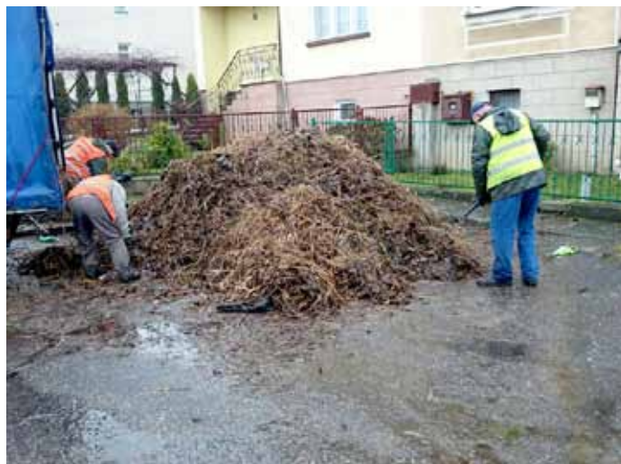
Wywóz odpadów zielonych z nad jeziora