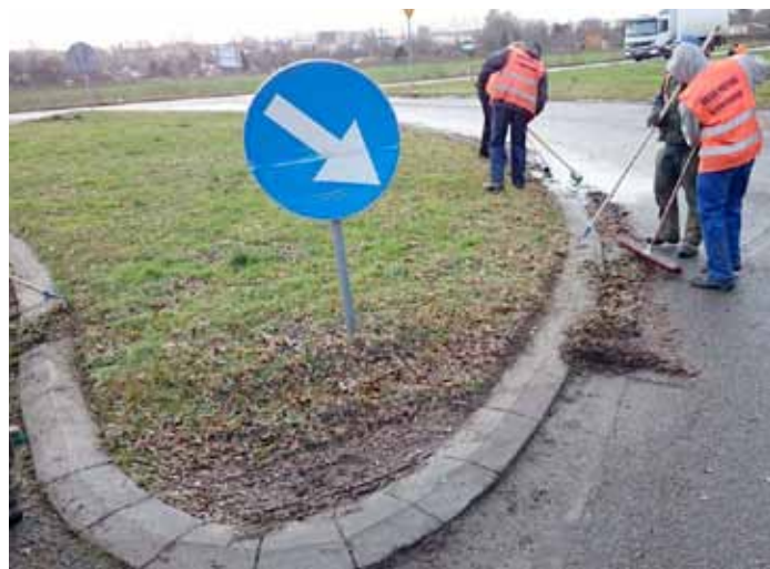
Skrzyżowanie na os. Bema