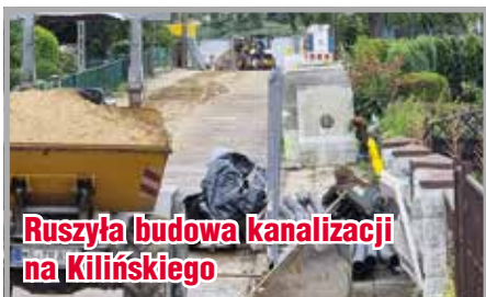
Ruszyła budowa kanalizacji na Kilińskiego