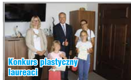
Konkurs plastyczny laureaci