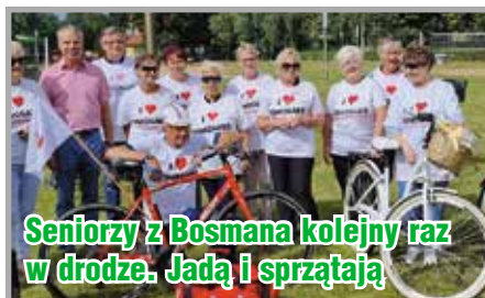
Seniorzy z Bosmana kolejny raz w drodze. Jadą i sprzątają