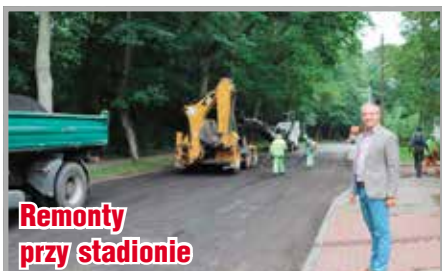
Remonty przy stadionie