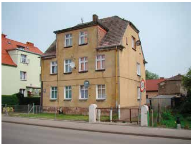
Ul. Bohaterów Warszawy przed remontem

Komisja dokona przeglądu i oceny budynków i otoczenia biorących udział w konkursie w oparciu: o niżej wymienione kryteria: wygląd, ogólne wraże-