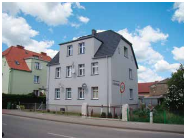
Ul. Bohaterów Warszawy po remoncie