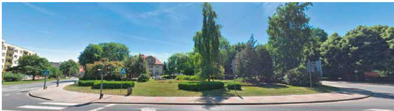
Plac Ofiar Katynia

134.995 zł – zwiększenie zabezpieczonej kwoty na rozbudowę drogi dojazdowej do Przedszkola Zielonego.