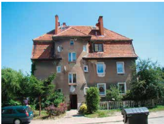
Ul. Waryńskiego przed remontem