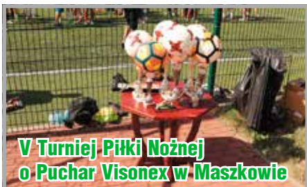
V Turniej Piłki Nożnej o Puchar Visonex w Maszkowie