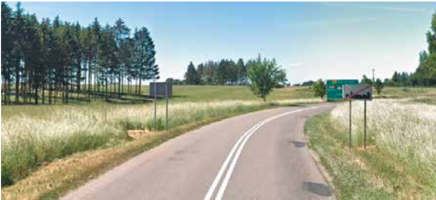
Droga z Warnkowa w kierunku Karska

Radni odrzucili również uchwałę, która wprowadzała zmianę w statucie sołectw, zrównując kadencję sołtysów i Rad Sołeckich z kadencją burmistrza i rady miejskiej. Sołectwa są jednostkami pomocniczymi Gminy, zaś każdy z sołtysów jest pomocnikiem burmistrza w realizacji jego zadań. Jest to bardzo ważna zmiana, jednak radni ją po raz kolejny blokują. Niby los terenów wiejskich jest im bliski, jednak w głosowaniach wygląda to inaczej. (ps)