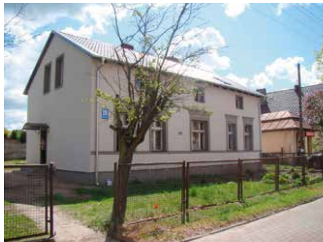
Ul. 3 Maja po remoncie