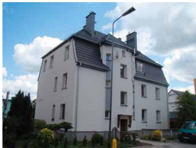
Ul. Waryńskiego po remoncie