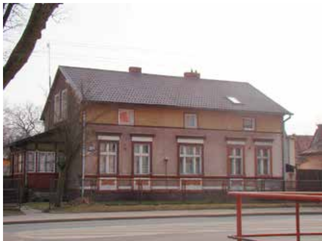
Ul. 3 Maja przed remontem

Od 2011 do 2018 łącznie w VIII edycjach wzięty udział 24 Wspólnoty Mieszkaniowe. Przyznano w sumie 7 nagród głównych po 10.000 zł oraz 14 wyróżnień po 1.000 zł. (ps)