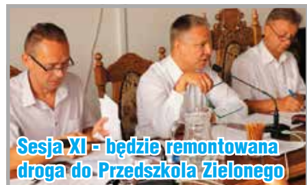
Sesja XI - będzie remontowana droga do Przedszkola Zielonego