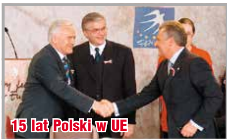
15 lat Polski w UE