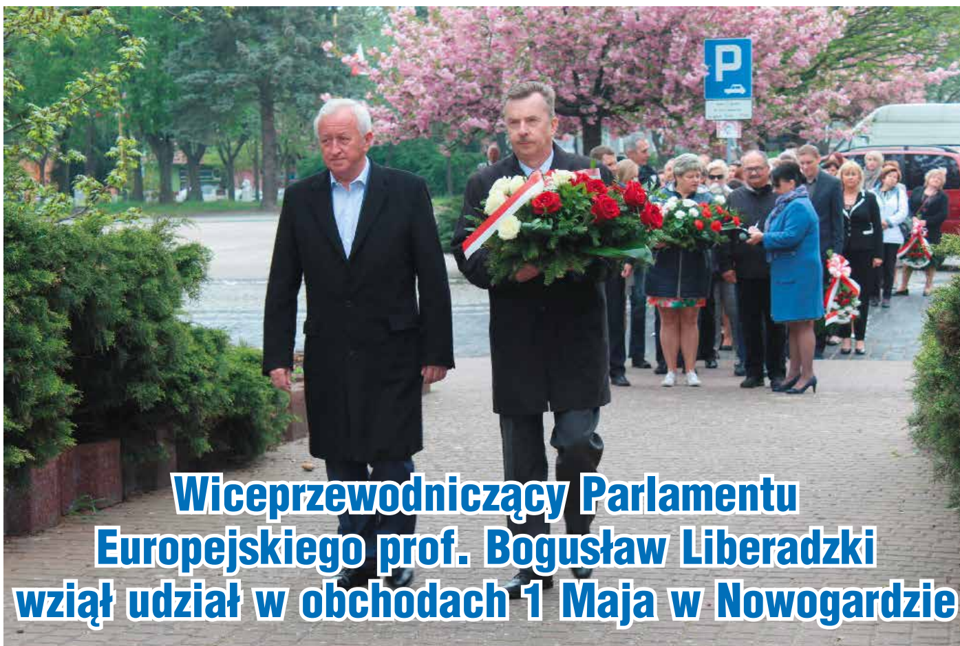
Wiceprzewodniczący Parlamentu Europejskiego prof. Bogusław Liberadzki wziął udział w obchodach 1 Maja w Nowogardzie