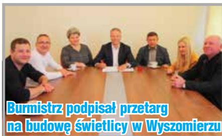
Burmistrz podpisał przetarg na budowę świetlicy w Wysomierzu