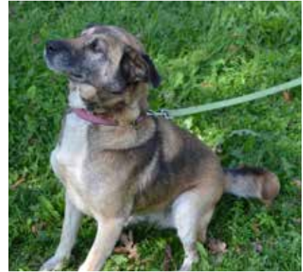
Lu Lu - samica, wiek 9 lat, 60 cm w kłębie.