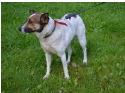
Tales – pie, wiek 5 lat 45 cm w kłębie