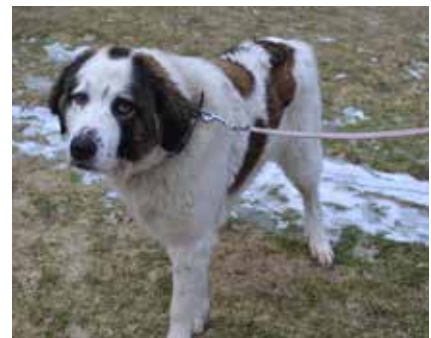
Kropka - samica, wiek 4 lata, 75 cm w kłębie.