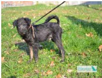
Poldek - pies, 25 cm w kłębie