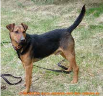
Opel - samiec, wiek 9 lat, 45 cm w kłębie

Godziny otwarcia schroniska - codziennie od 9.00 do 18.00.