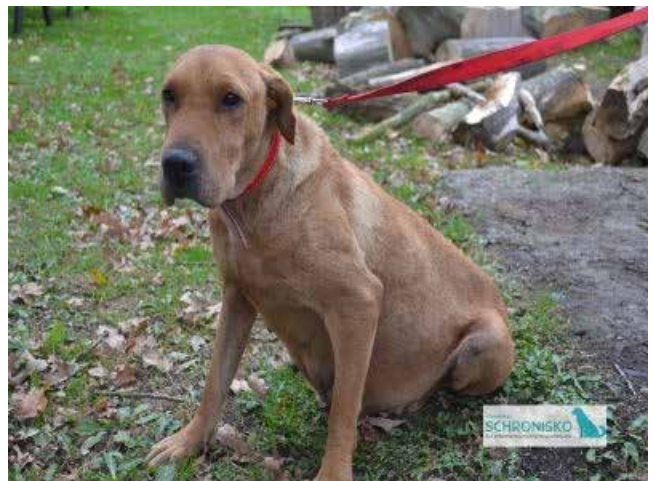
Knieja – suczka, wiek 3 lata 50 cm w kłębie