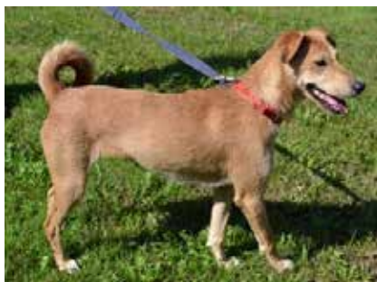
Dzezi – suczka, wiek 1 rok 45 cm w kłębie