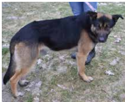
Odi - samiec, wiek - 4 lata, 60 cm w kłębie.