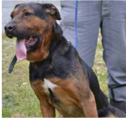
Dżeki - samiec, wiek 9 lat, 60 cm w kłębie.