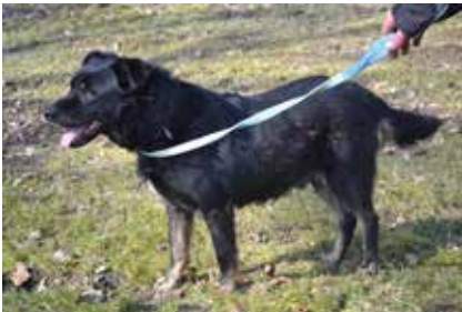
Narcyz - samiec, wiek 9 lat, 55 cm w kłębie.