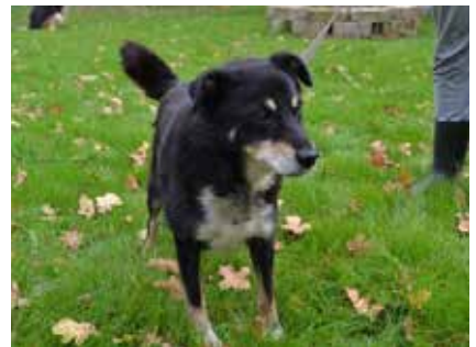
Melon - pies, wiek 9 lat, 25 cm w kłębie