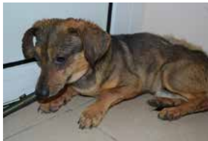
Knypek- samiec, wiek 5 lat, 25 cm w kłębie, bojaźliwy.