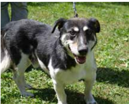
Kumpel - samiec, wiek 7 lat, 40 cm w kłębie.