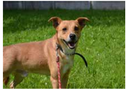
Rydz - samiec, wiek 3 lata, 40 cm w kłębie