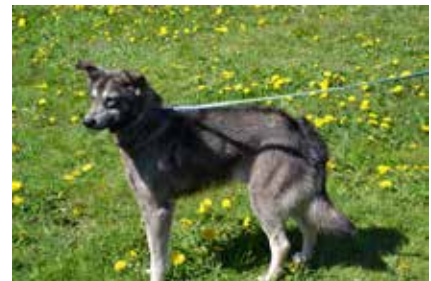
Szarik - samiec, wiek 5 lat, 50 cm w kłębie.