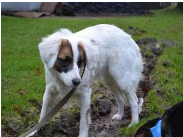
Pysia – suczka, wiek 1 rok 43 cm w kłębie