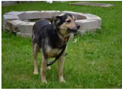
Wicek - samiec, wiek 2 lata, 50 cm w kłębie.