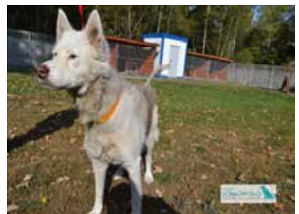
Ddiana – suczka, wiek 10 lat 53 cm w kłębie