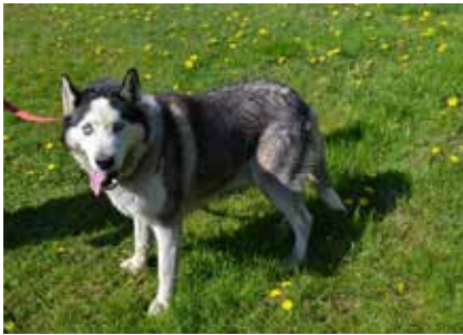
Ziomek - samiec, wiek 9 lat, 55 cm w kłębie.