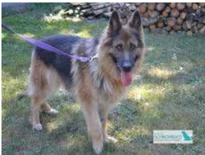
Diuna – suczka, wiek 5 lat, 60 cm w kłębie